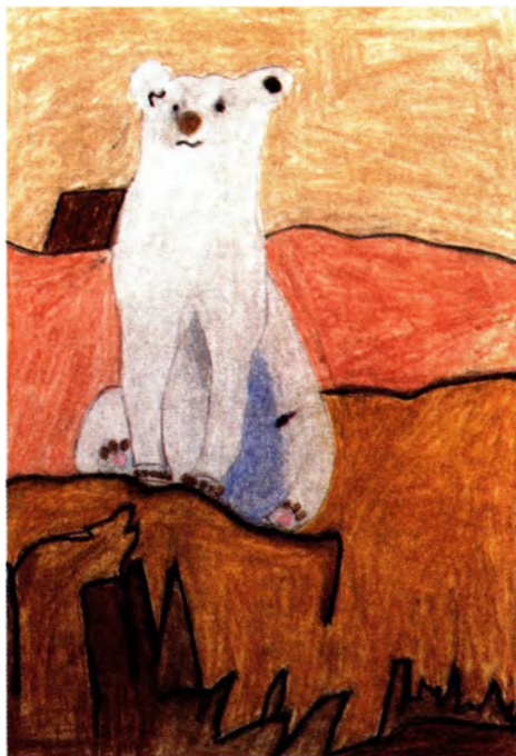
Вика Ситало, 12 лет. 2002 г. (Отделение медицинской генетики)