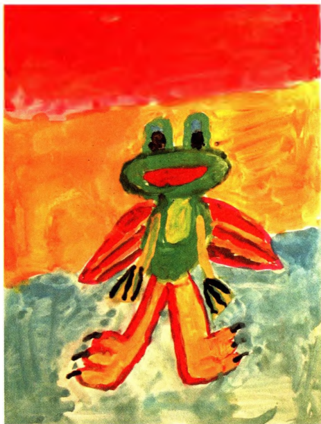
Дима Волков, 10 лет. 2006 г. (Отделение онкогематологии)