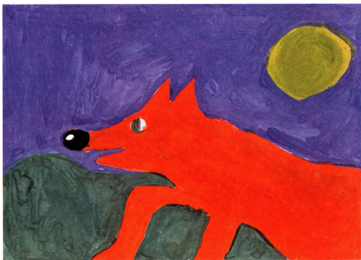
Аня Ведякина, 8 лет. 2008 г. (Отделение микрососудистой хирургии)