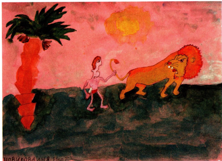
Аня Новикова, 13 лет. 2008 г. (Отделение пересадки почки)