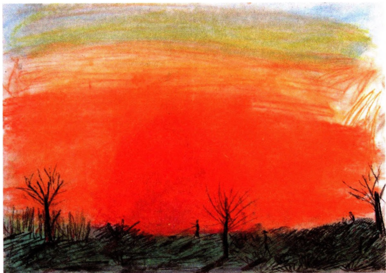
Саша Самойлов, 10 лет. 2001 г. (Отделение пересадки почки)