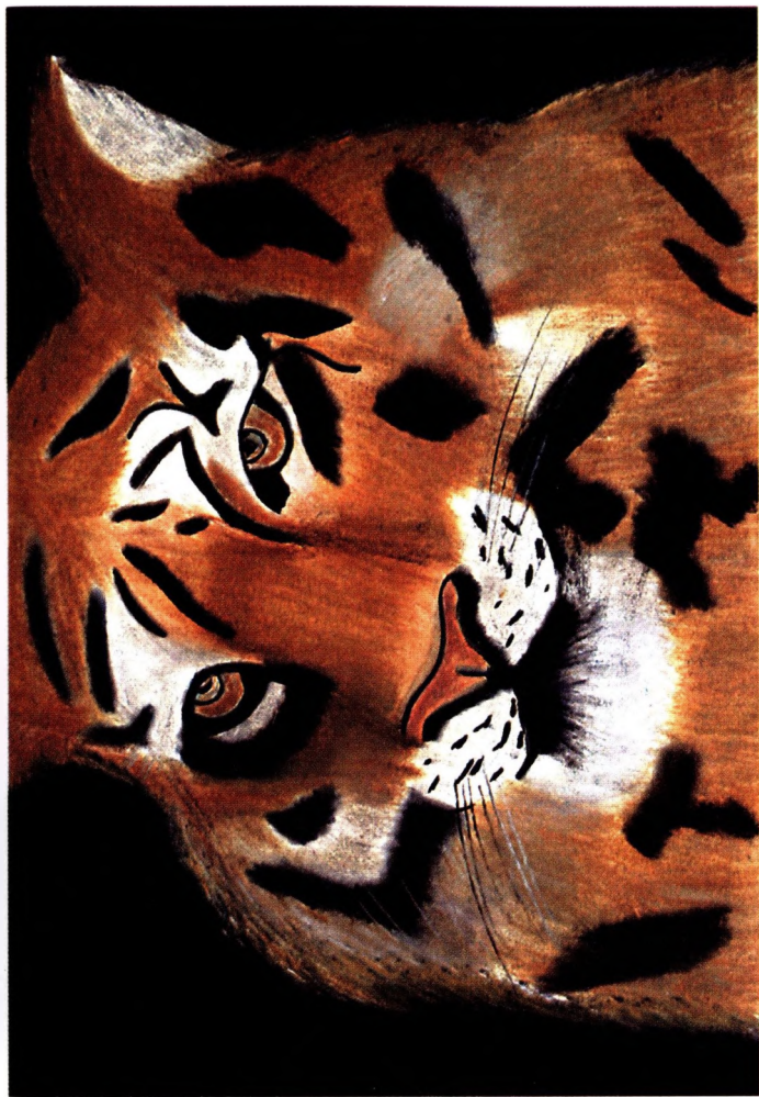
Таня Лоскутова, 15 лет. 1996 г. (Отделение пересадки почки)