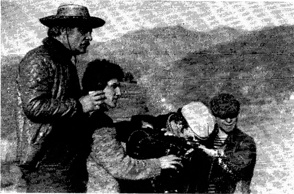
На съёмке фильма. Слева режиссёр-постановщик — Георгий Данелия