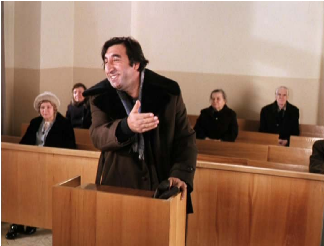
Рубен Хачикян — артист Фрунзик Мкртчян