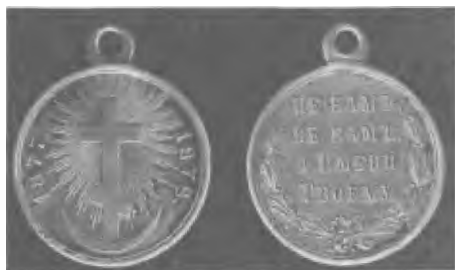
Медаль «В память русско-турецкой войны 1877–1878 гг.»