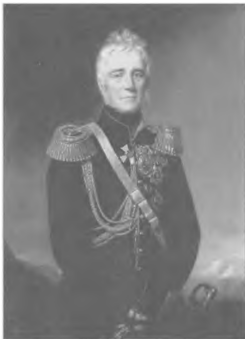
Наместник Кавказа граф М.С. Воронцов