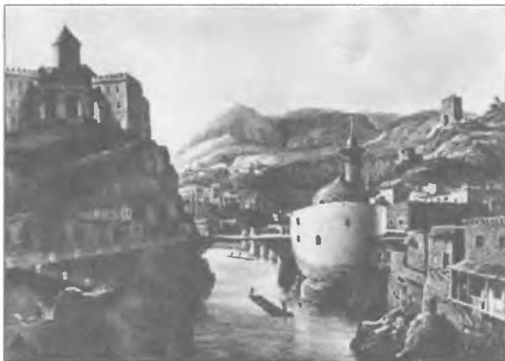
Тифлис. Старый город