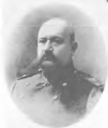
Генерал Н. Н. Юдин