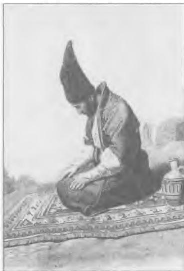
Горец во время намаза