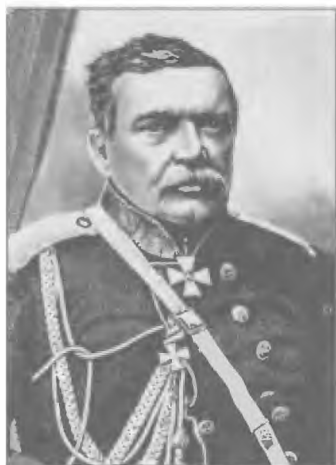
Царский наместник в Тифлисе и главнокомандующий русскими кавказскими войсками генерал от инфантерии Н.Н. Муравьев