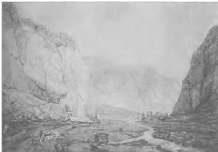
Дарьяльское ущелье. Рисунок М.Ю. Лермонтова