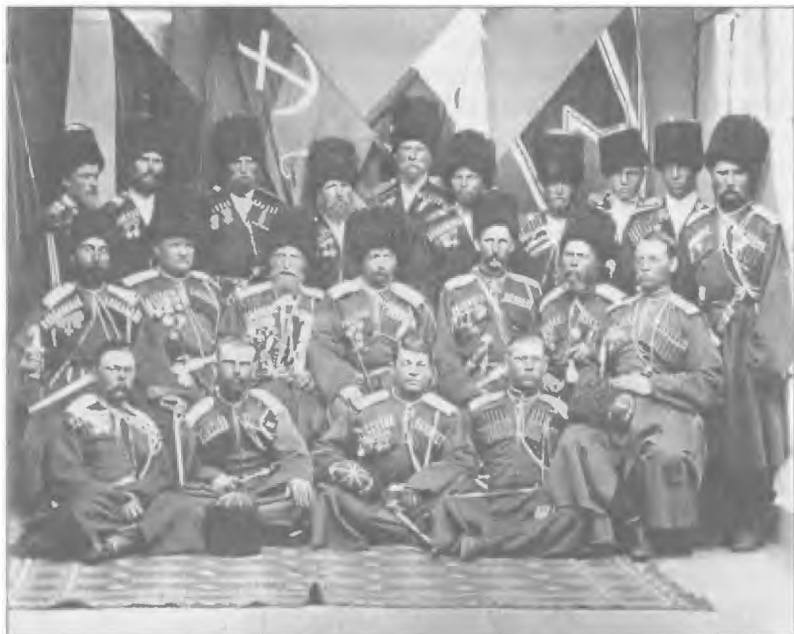
Офицеры 1-й бригады Кубанского казачьего полка