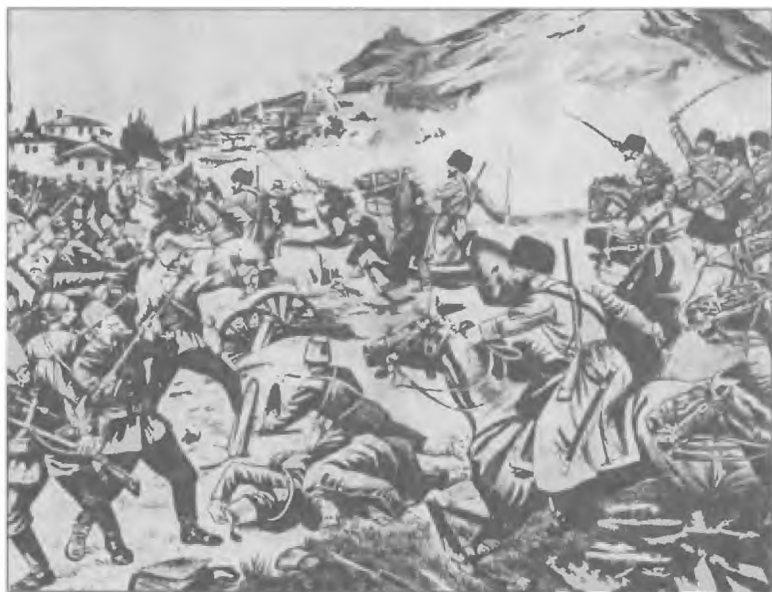
Бой под Ардаганом