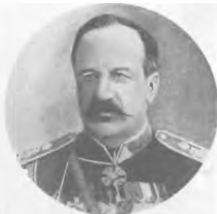
Граф Н. И. Воронцов-Дашков