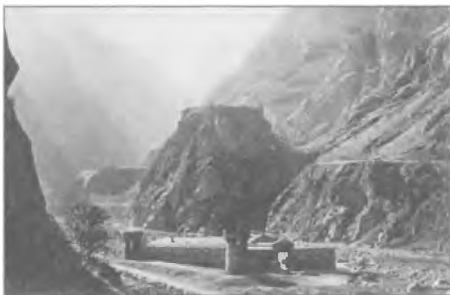
Военно-Грузинская дорога. Башня царицы Тамары и Дарьяльское укрепление