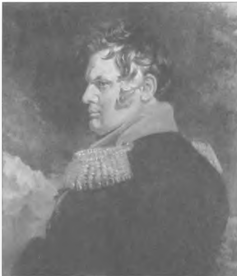
Генерал А.П. Ермолов, прозванный еще при жизни «проконсулом Кавказа»