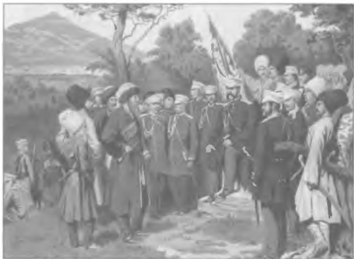
Пленный Шамиль представляется князю Барятинскому