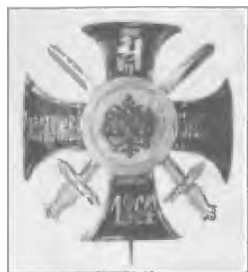
Наградной крест «За службу на Кавказе»