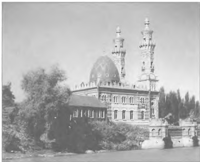
Мечеть во Владикавказе