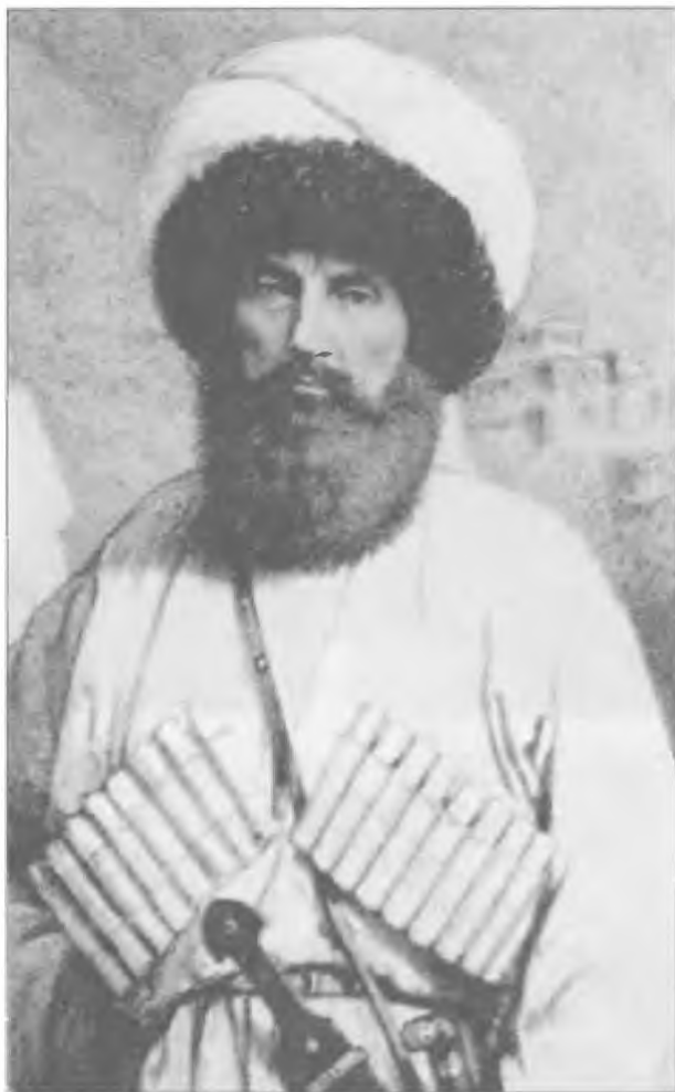
Имам Чечни и Дагестана Шамиль. Турецкий султан возвел его в звание генералиссимуса и очень надеялся на то, что «немирные» горцы нанесут сильный удар в спину русским войскам в Закавказье