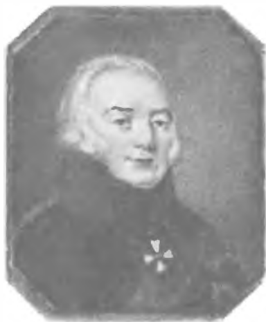
Князь П.Д. Цицианов