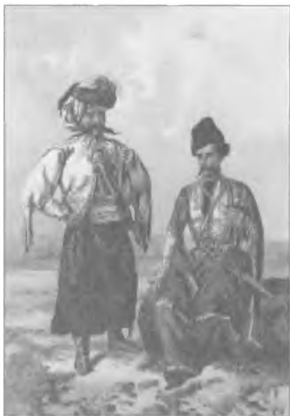
Курд и армянин