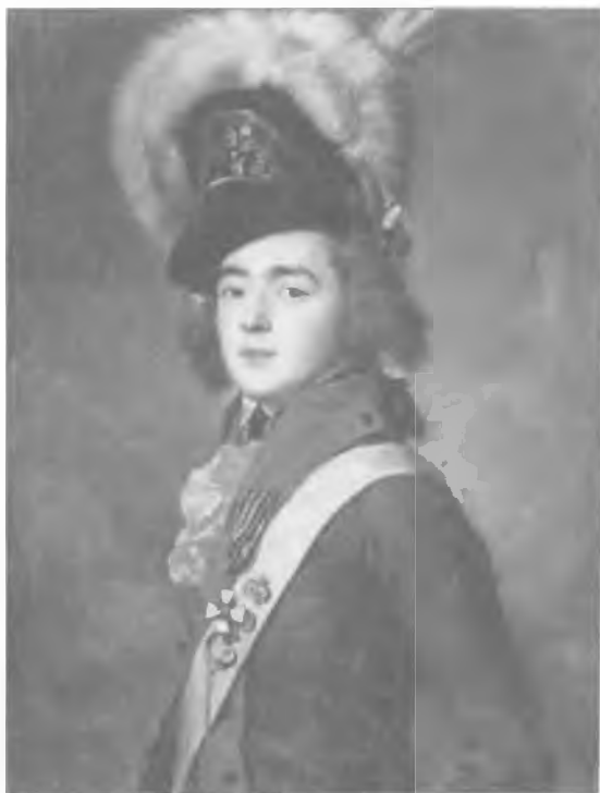
Генерал-адъютант Валериан Зубов