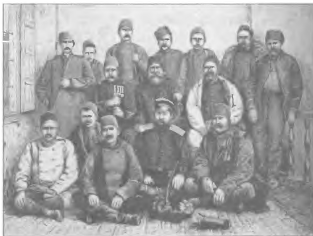
Группа турецких офицеров