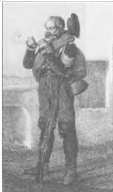
Унтер-офицер кавказского саперного батальона в походной форме