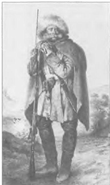
Солдат отдельного Кавказского корпуса во время зимнего похода в Дагестан