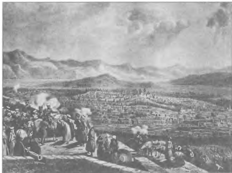
Взятие Эрзерумской крепости