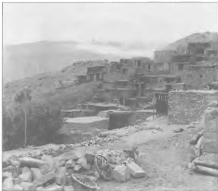
Родной аул Шамиля