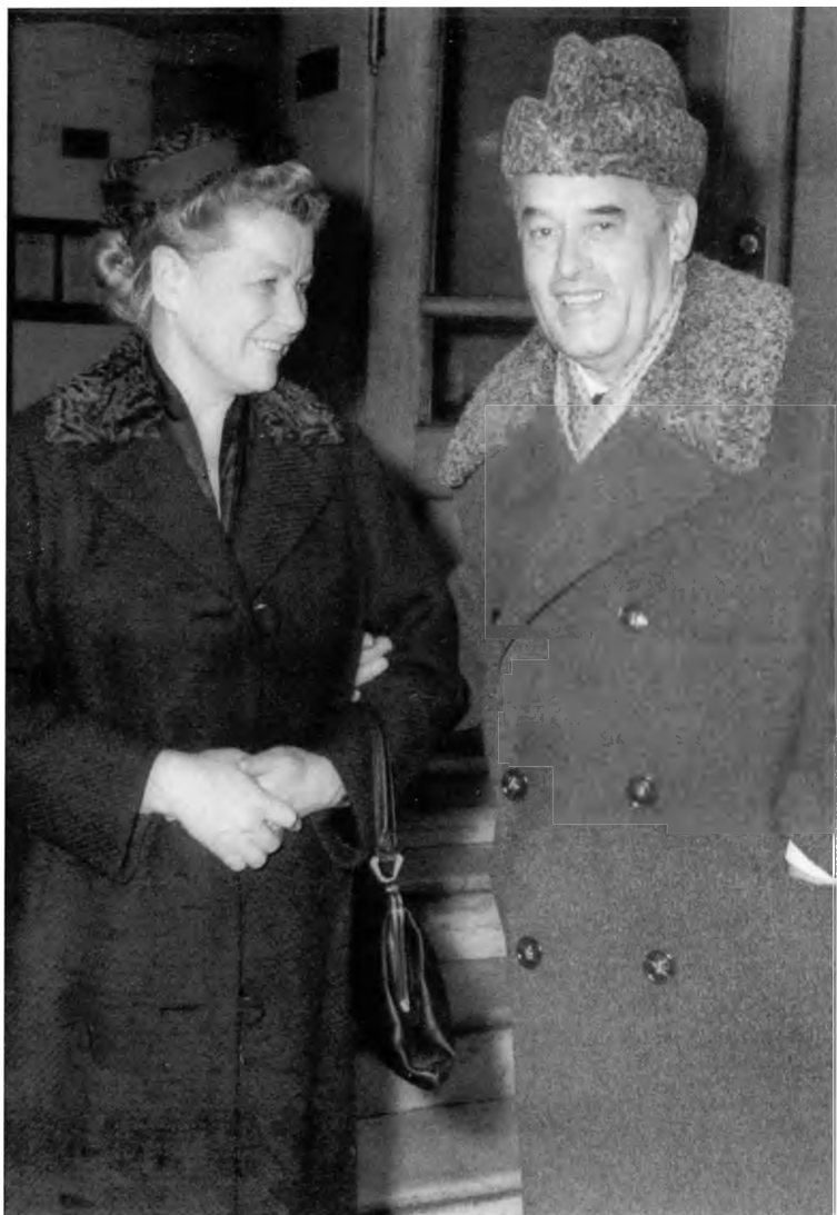
Екатерина Алексеевна Фурцева и Николай Павлович Фирюбин