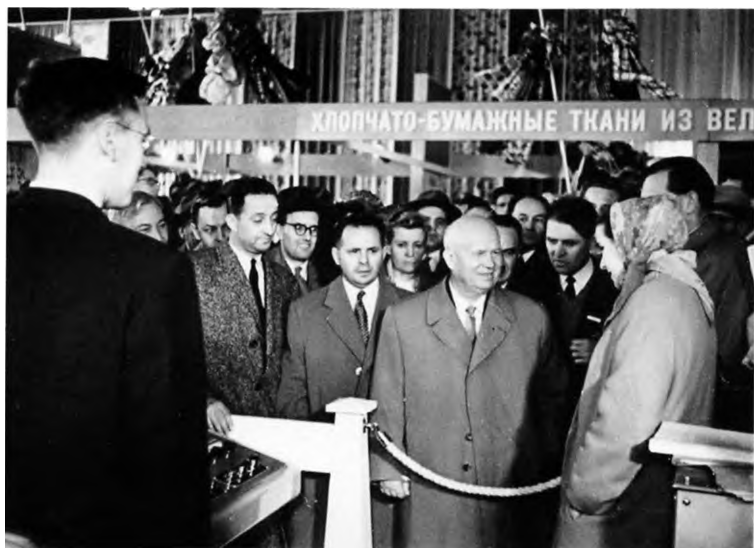
Н. С. Хрущев сделал Е. А. Фурцеву своим соратником и доверил ей управление Москвой