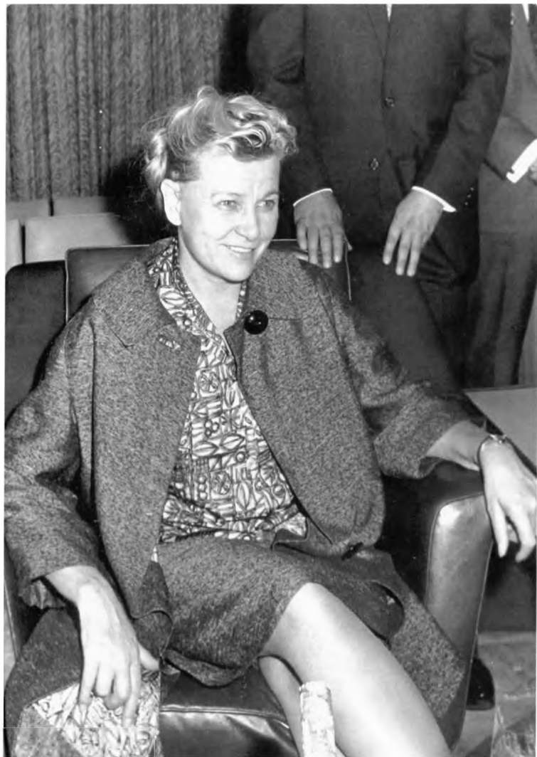
Самый красивый министр культуры