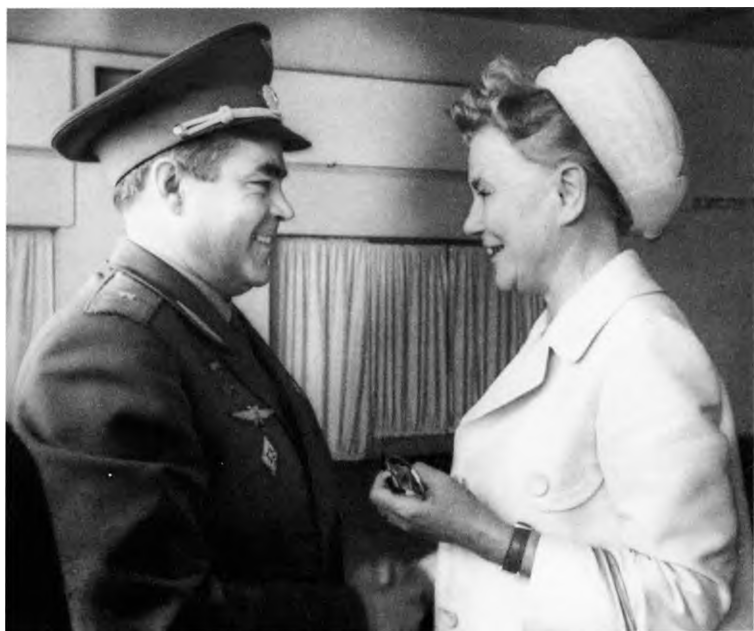
С Андрияном Николаевым