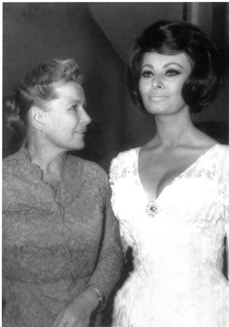
С Софи Лорен