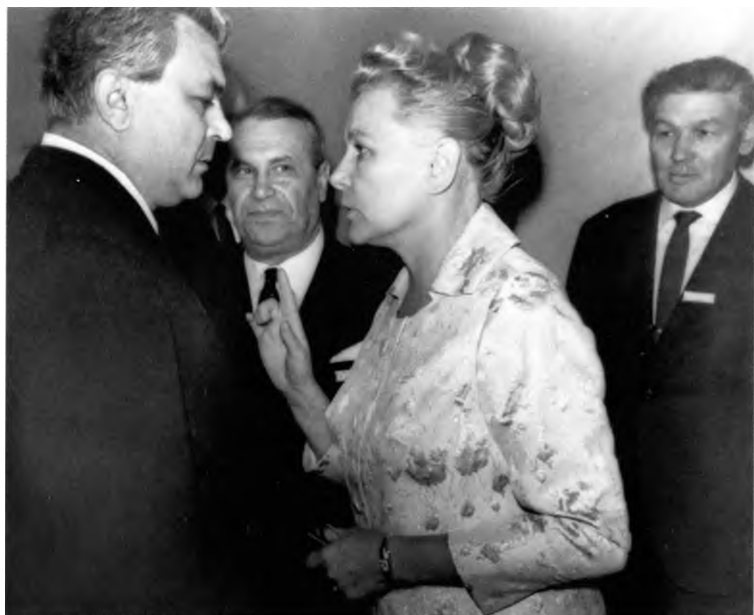
Сергей Бондарчук, Марк Бернес, Екатерина Фурцева и Всеволод Санаев