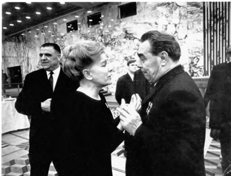
С Леонидом Брежневым