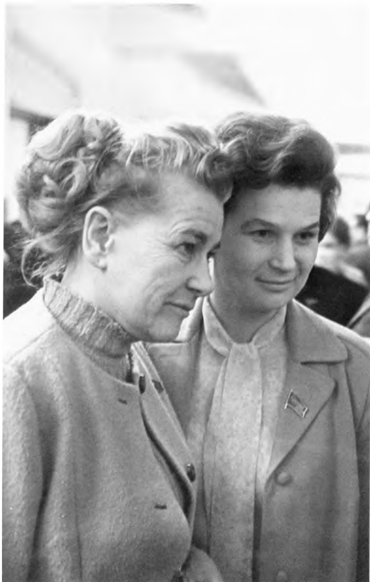
С Валентиной Терешковой