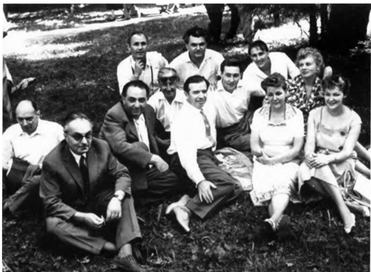
Фурцева в окружении «звезд» советского кинематографа