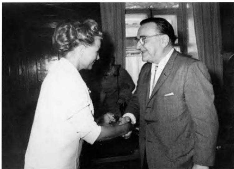
С Федором Шаляпиным