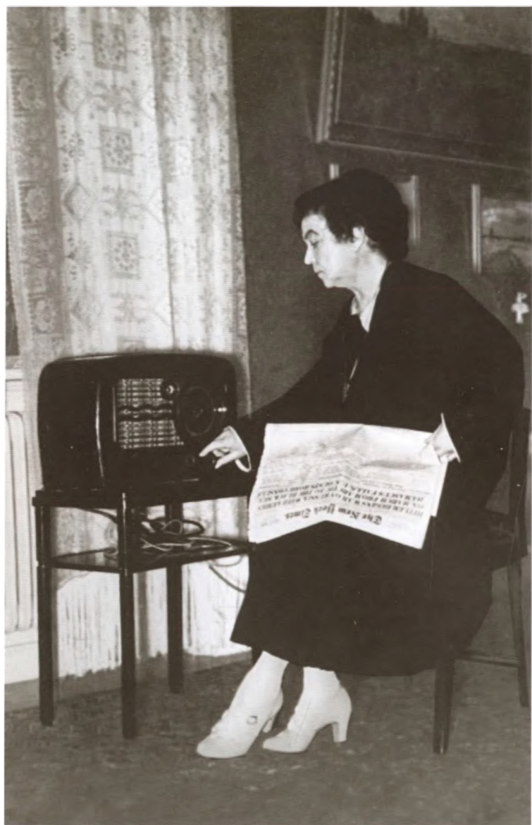
Коллонтай слушает радио