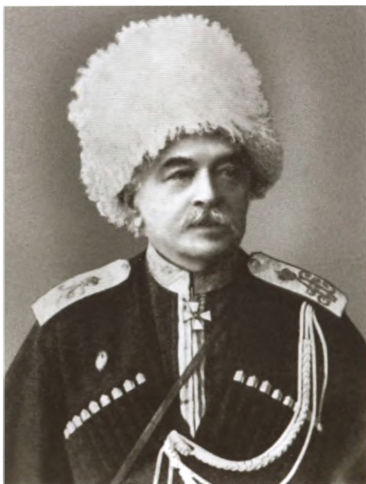
Михаил Иванович Драгомиров