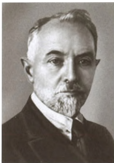
Леонид Борисович Красин