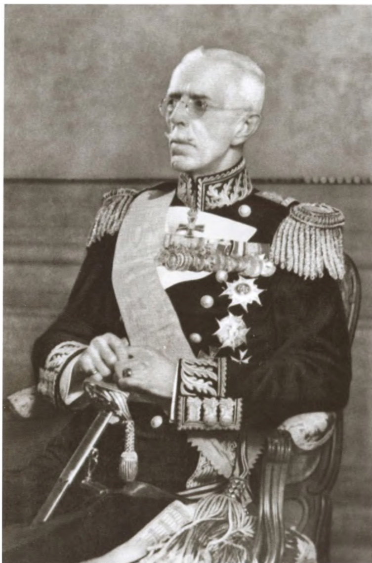
Король Швеции Густав V