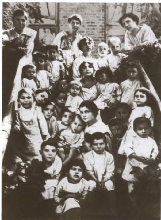
А. М. Коллонтай среди беспризорников. Начало 1918 г.