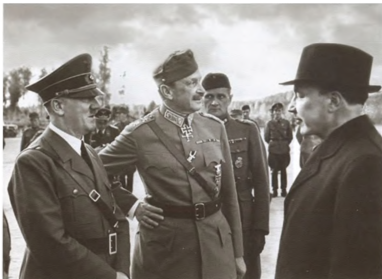
Адольф Гитлер и Карл Густав Эмиль Маннергейм (в центре)