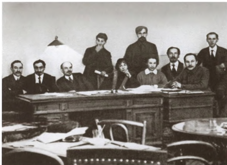
Заседание Совнаркома с участием В. И. Ленина. Пятая слева — А. М. Коллонтай. Петроград, 1918 г.