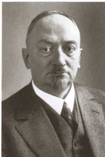
Георгий Васильевич Чичерин