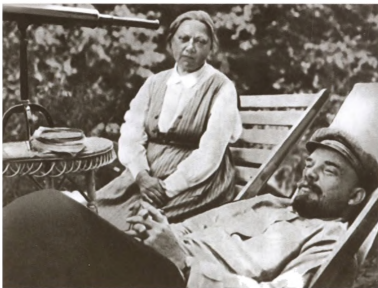
В. И. Ленин и Н. К. Крупская в Горках. 1922 г.