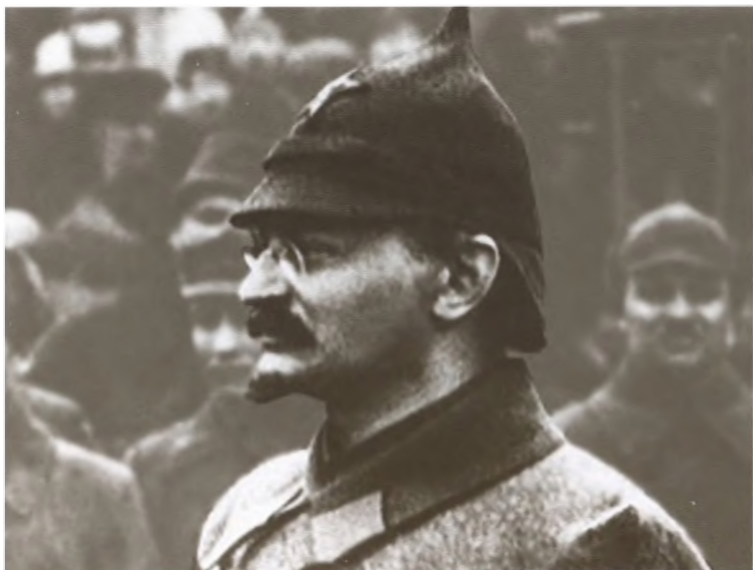
Лев Давидович Троцкий