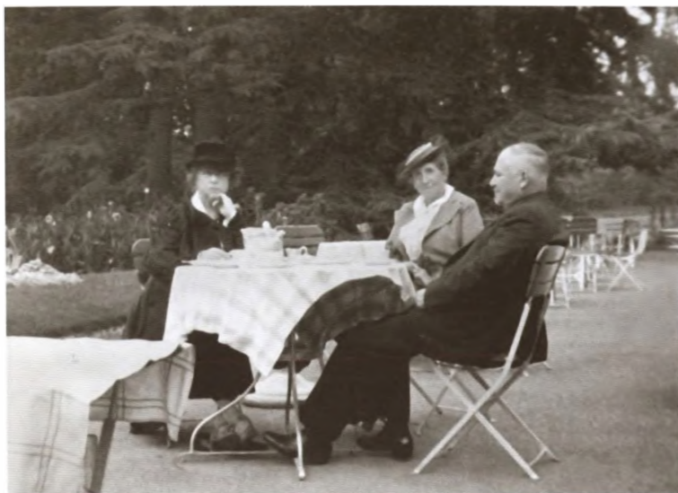
А. М. Коллонтай со знакомыми в кафе. Стокгольм