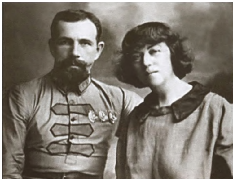
Павел Ефимович Дыбенко стал вторым мужем Александры Михайловны Коллонтай