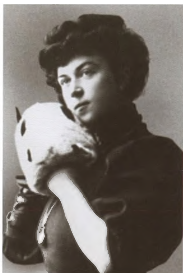
Александра Михайловна Коллонтай