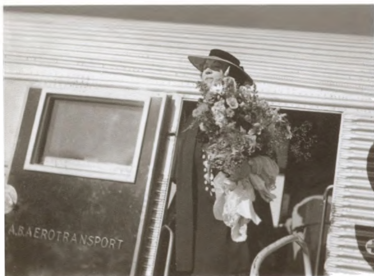
А. М. Коллонтай уезжает в Москву