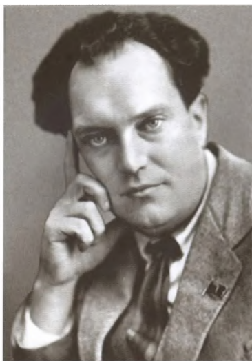
Валериан Владимирович Куйбышев