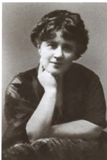
Татьяна Львовна Щепкина-Куперник