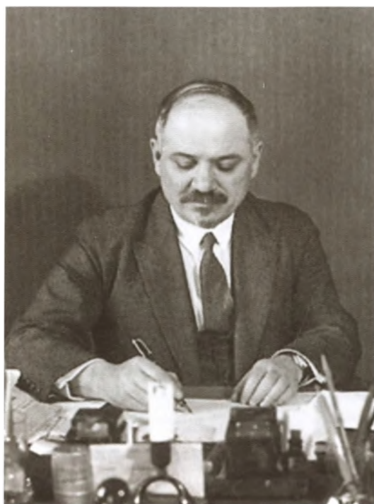
Иван Михайлович Майский