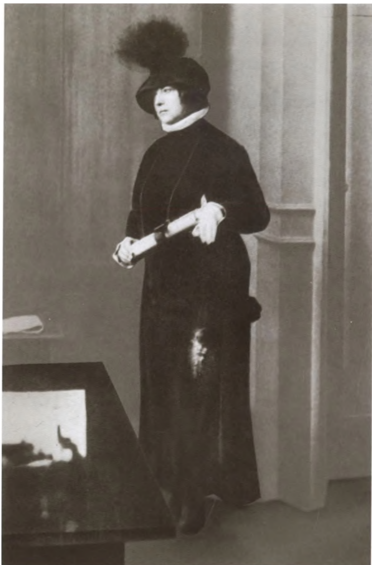
А. М. Коллонтай перед вручением верительных грамот королю Норвегии Хокону VII. Осло, сентябрь 1924 г.