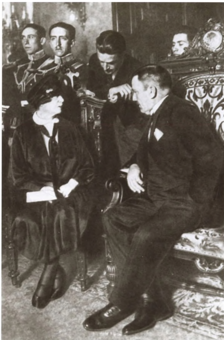
А. М. Коллонтай и президент Мексики Элиас Кальес после вручения верительных грамот. Мехико, 24 декабря 1926 г.