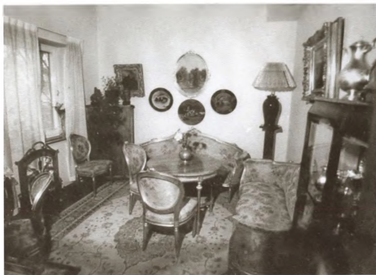
Мемориальная комната А. М. Коллонтай в посольстве СССР в Швеции. 1982 г.