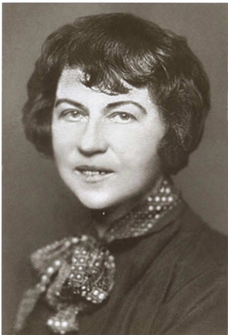
А. М. Коллонтай