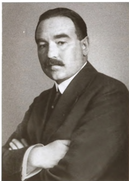
Александр Гаврилович Шляпников