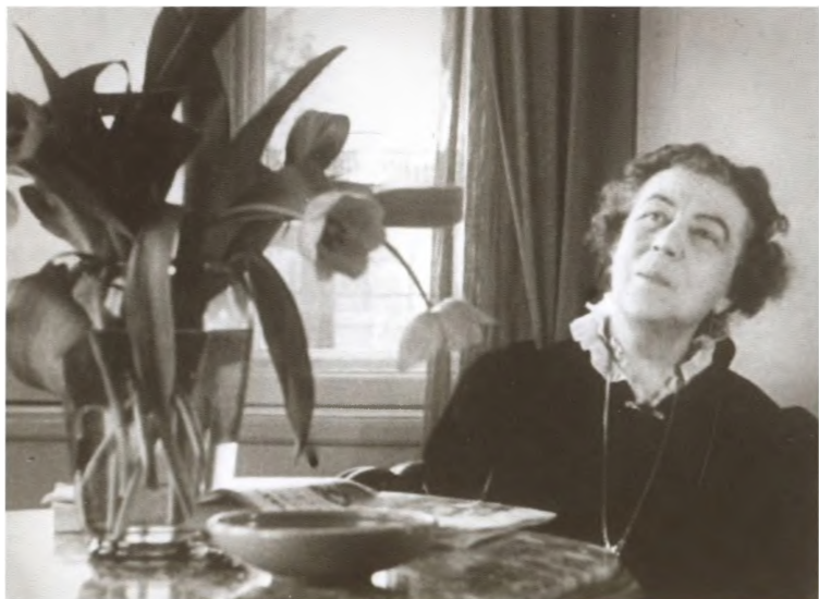
В рабочем кабинете. Стокгольм