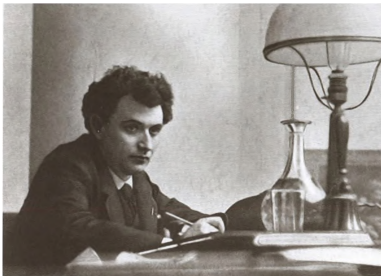
Григорий Евсеевич Зиновьев