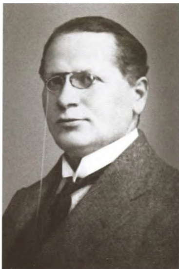
Максим Максимович Литвинов

Вячеслав Михайлович Молотов (в центре) с женой Полиной Жемчужиной (вторая справа) на дипломатическом приеме