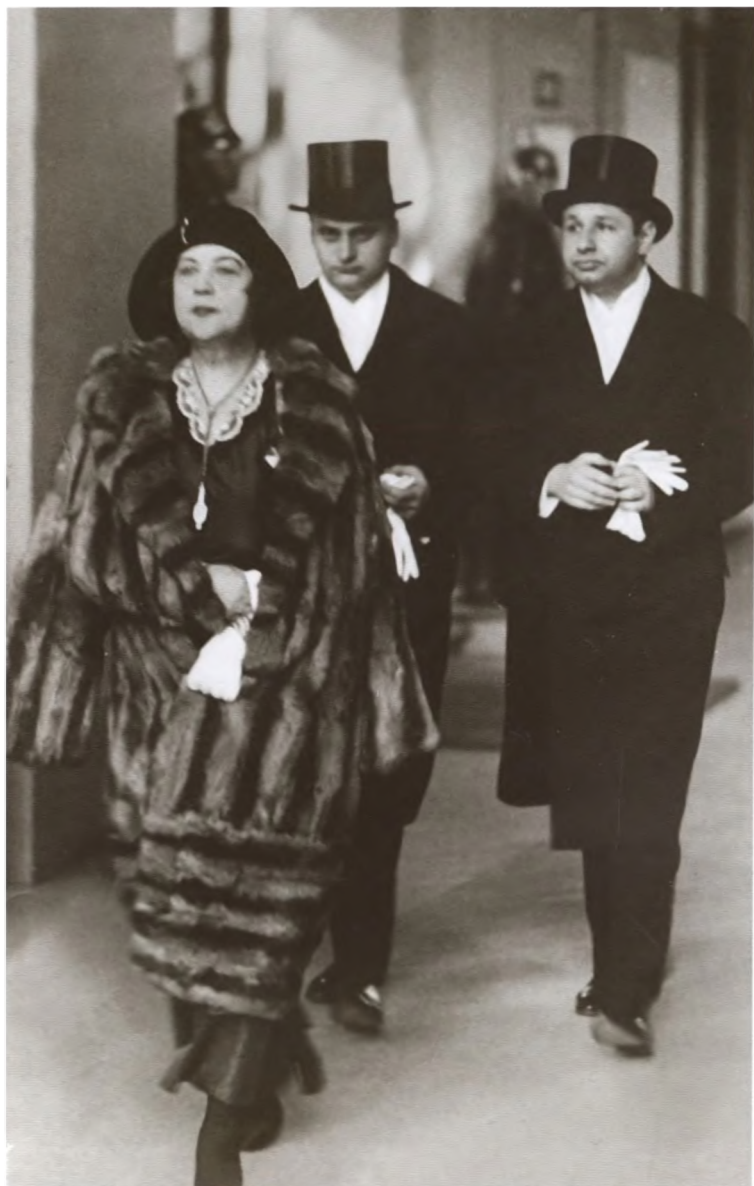
А. М. Коллонтай — чрезвычайный и полномочный посол СССР в Швеции