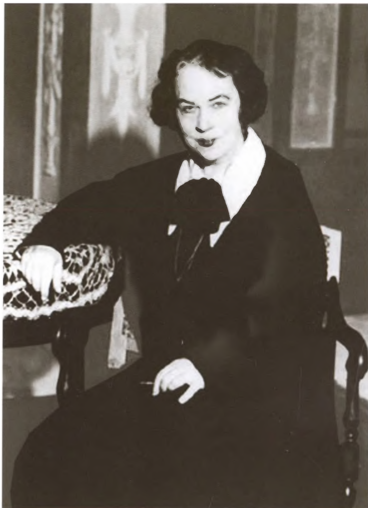
Александра Михайловна Коллонтай