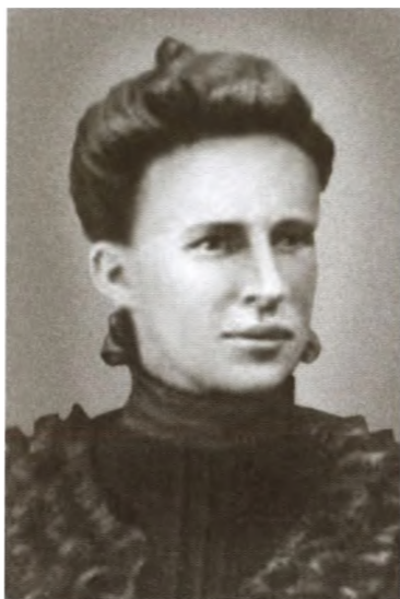
Елена Дмитриевна Стасова