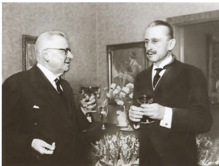
Юхо Кусти Паасикиви и Карл Густав Эмиль Маннергейм